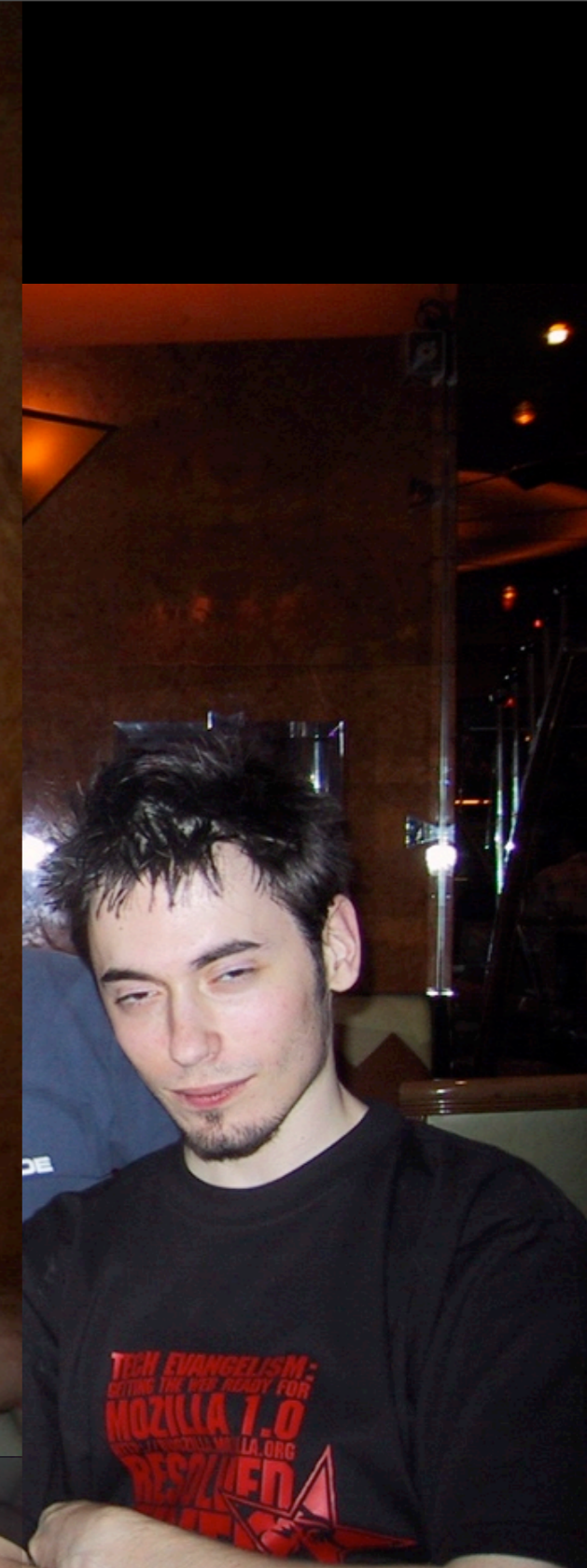
1er Web Standards meet-up, 2 août 2002